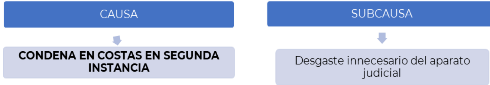
Condenas en Costas en Contra de la UGPP

Análisis de Causas y subcausas – Tipologías: ¿Cuál es la razón fundamental por la que surge el litigio o el riesgo del litigio?